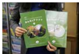
「みんなのアドプト」1、2号