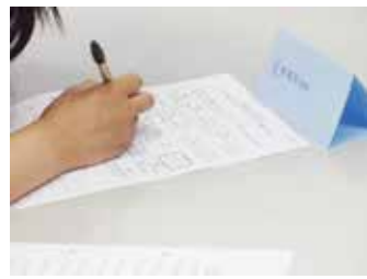
自己分析で新たな自分を発見

全てのプログラムを終え、1 月におこなった修了式では一人一人が胸を張り、成長した姿を見せてくれたことに、涙なしではいられませんでした。ここまで来るのに約半年間、大変なこともありましたが、一生懸命がんばる彼らの姿が私たちの励みになると同時に、多くの学びを得ることもできました。彼らと共に歩み、共に成長してこられたことを嬉しく思います。無事に修了式を迎えられたのは 9 名。決して多い数ではありません。しかし彼らにとってはここからが始まりです。そんな彼らが自信を持って就労できるよう、私たちはこれからもサポートの手を止めることはありません。そして、まだまだ社会の中に埋もれている若者が一人でも多く、未来に向かって歩き出せるよう、地域全体で取り組んでいかなければと思います。(T)