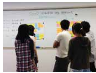
さまざまなワークを通して「働く」をイメージ