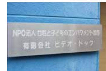
ブルーの壁が印象的な阪急小林駅徒歩 5 分の本部事務所

C A P ( Child Assault Prevention ) = “子どもに対する暴力防止” を目的に作られたプログラム。その専門家養成講座を日本で最初に開催し、今も全国区で活動をされている特定非営利活動法人女性と子どものエンパワメント関西は「女性と子どもの社会参画」を通じ「一人ひとりが大切にされる社会」を作り「平和で平等な世界」の実現に向けて活動されています。今号は理事長の田上時子さんから宝塚市小林にある法人事務所でお話を伺いました。