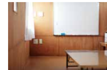
事務所地下 1 階親たちの交流と相談の場「ほっとすべ〜す」