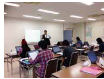
職場体験先に向けパソコンで履歴書作成