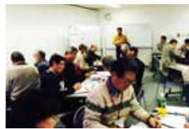
アドプトをもっと良くする会議

道路や河川などの公共エリアの草刈り、植樹管理などの維持や美化活動を市民の皆さんと協働して行う制度です。