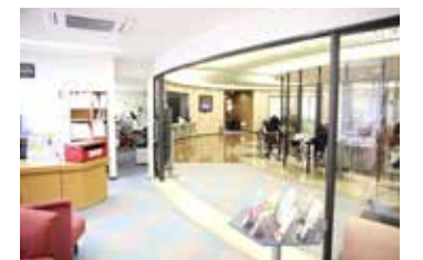
各線宝塚駅前「男女共同参画センター・エル」