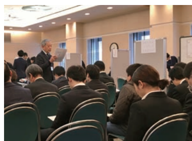
「面接ミニセミナー」の参加者は 真剣な面持ちで受講

また、今回は開始前に面接に臨む心構えやマナーについての「面接ミニセミナー」の実施を試みたところ、参加者からは「直前のセミナーが役に立った」という声をいただきました。この面接会で内定に結びついた人、応募はしなかったけれど会社の説明を聞いた人、とそれぞれですが、就職活動をする皆さんにとってよい機会になったと思います。