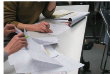
ワーク形式の講座も