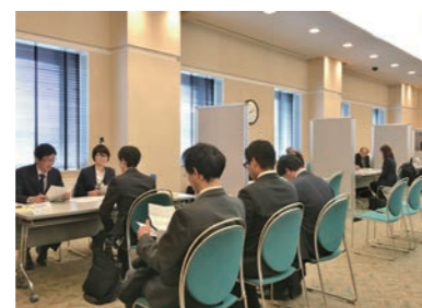
待ち時間は心の準備。面接では それぞれに思いを伝えていました