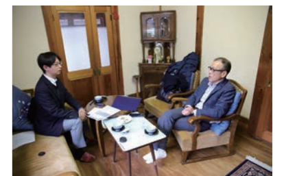
雰囲気のある一室で講習を行う