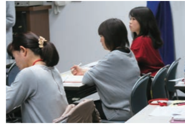
講座を受ける姿は真剣そのもの

今回の講座参加の皆さんも「自分の想い＝こだわり」を持ち、講座終了後から動きだしています。皆さんの様子は宝塚NPOセンターのFacebookで適宜ご紹介をいたします。ご期待ください。