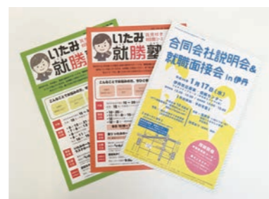
今年度は31名が受講し、 19名の就職が決まりました!