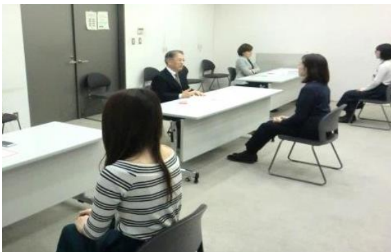
本番さながらの模擬面接。緊張しながらも何度も挑戦しました