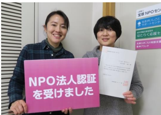
NPO法人を設立された『親子会エルフ』さん