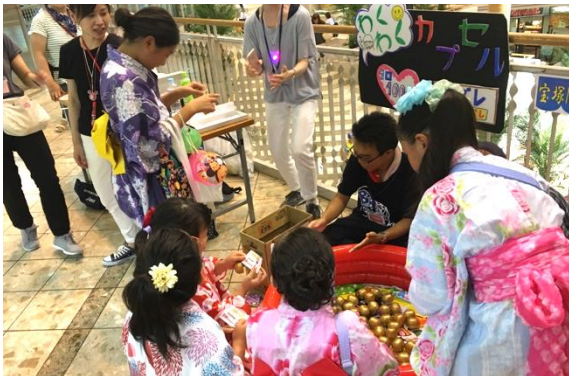
ソリオ宝塚ふれあい夏祭りでは、模擬店の出店を体験

働くことで社会に参加することを支援し、就職成立者を増やします。就職までの支援だけではなく、継続して働くための支援も行っています。また、事業者はもとより多くの市民に現在の雇用状況を伝えることで、地域の理解を深めることを目的としています。