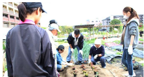
ツカベジ農園では多くの相談者が毎週定期的に参加しています

本事業の『はたらく応援センター』は、宝塚市役所内の『せいかつ応援センター』の福祉的支援と共に就労支援を行っています。平成29年度はツカベジ農園や講座などに参加する相談者が増え、就職への一助として有効であると感じました。平成30年度以降も講座や相談者の就労意欲を高めるプログラムの充実を図ります。