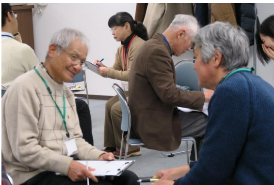
『もっとアドプトをよくなる会議』で課題について話し合い

平成 29 年 4 月から公開された『宝塚市みんなのまちづくり協議会』ポータルサイトの安定した運営・情報更新に取り組み、ポータルサイトに含まれるまちづくり協議会のブログについては、まちづくり協議会の皆さんに情報発信の仕方を丁寧に説明しました。広報の企画では、まちづくり協議会のキャラクター『まちキョン』を生かしたグッズの作成やイベント訪問記を作成。親しみを持ってまちづくりに関わってもらえるよう取り組みました。