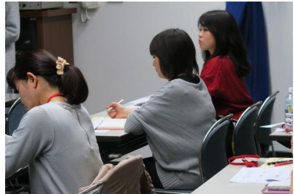
募集定員を超える申し込みのあった女性起業セミナー。既に起業された方や平成 30 年度に起業予定の方が多くいます

社会的課題への取り組みをビジネスとして立ち上げるにはどのようにすればよいかをワークショップを通して学び、先進事例として実際の現場を見学することで、起業への第一歩のイメージを高めてもらいました。