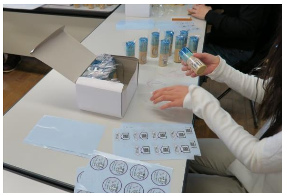
広報グッズは宝塚地域若者サポートステーションの利用者やボランティアさんと協働で作成