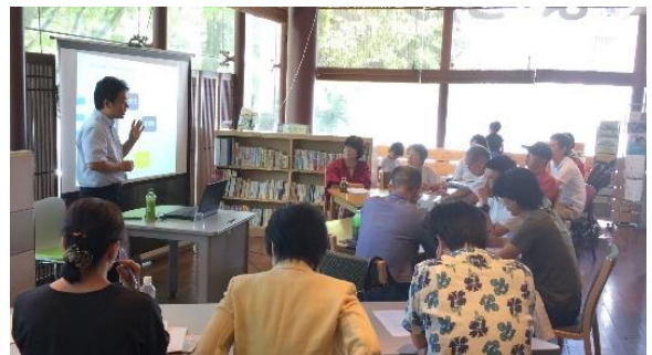
『NPOのツクリカタ「小さな団体の広報」』講座で、マスメディアへの発信やSNSとホームページの活用について学習しました

平成29年4月からまちづくりを推進する指定管理業務を新たに受託しました。交通の便利な阪急伊丹駅ビルから移転したこともあり、比較可能な平成27年度に比べて会議室利用数、来館者数、印刷利用は減少したものの、市民活動などの相談件数は6割増、利用者のすそ野を示す団体登録数も7割増と大幅に増加しました。引き続き、多様な媒体を活用した広報で認知度を高めるとともに、まちづくりに役立つ魅力的な講座やイベントなどで来館者数の増加を図ります。