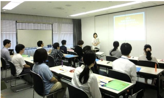
不安や期待を共有しながら、就労へ向けて一歩ずつ取り組みました

本事業を宝塚市より受託して9年目。就労に課題を抱える若者に対して、約半年間のプログラムを通じて段階的な支援を行っています。自己分析や仕事理解、応募書類作成などの講座に加え、事務作業や清掃体験、ソリオ宝塚ふれあい夏祭り出店などの体験講座も実施。働くイメージ、就労意欲を育てながら、一人ひとりに適切な進路決定をサポートし、受講者の3分の2以上の9人が進路を決めることができました。