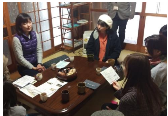
念願がかなって古民家を運営している起業家から、現在の様子や今後の夢について語っていただきました