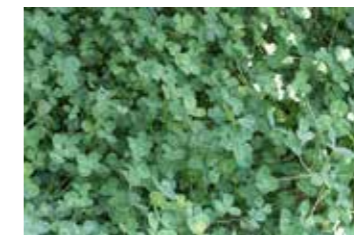
敷地内全体に防草対策としてクローバーを植えています