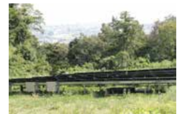
年間平均予想発電量 52,668kWh