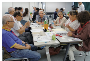
初対面とは思えない活発な意見交換

※1 協働のまちづくりの促進についての重要な事項の調査、審議に関する事務を行う宝塚市の審議会