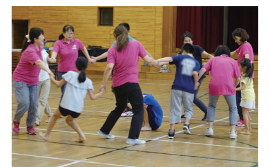
体操や遊びが自立につながる

NPO法人スマイル仁川 連絡先 E-Mail: smile@ina.ne.jp Web: https://smile-nigawa.jimdofree.com/