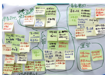
ご意見・アイデアが協働や困りごと解決のきっかけに