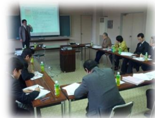
養父市商工会でのNPO勉強会