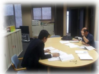
養父市大屋地域局にて個別相談

相談窓口の少ない但馬地域において、一年間を通して、個別相談会と訪問相談を実施する事により、個々の団体の課題に寄り添い、不安定な組織の立ち上がり時期に、適切なフォローアップを実施する事ができました。