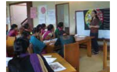
協働で現地の先生に栄養教育