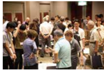
後半の意見交換会でそれぞれの思いを共有しました