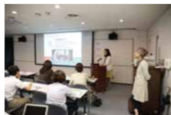
最終日、SB事業計画を個人発表