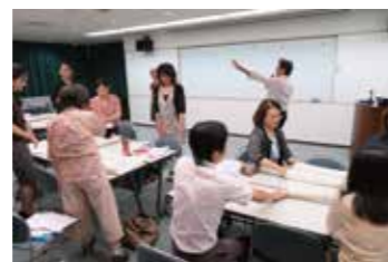
ワークショップで学ぶ収支計画