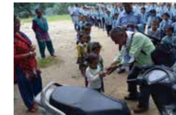
衛生教育キットの配布