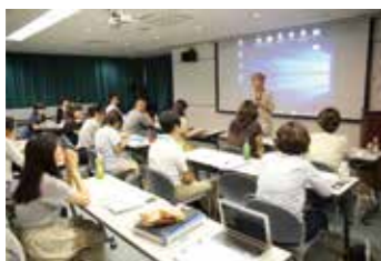
ほとんどの参加者が皆勤で参加