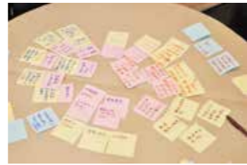
みんなの足で支える円形机「えんたくん」