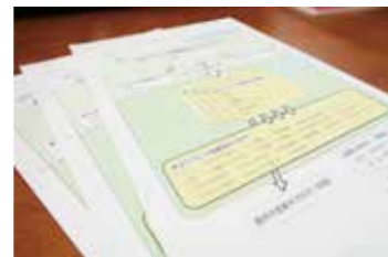
「情報発信のための拠点づくり」についての図解資料