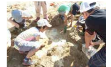
砂場で水遊び。楽しかった記憶。感触や匂いはいつまでも忘れません