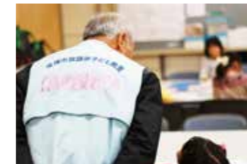
地域ボランティアは水色のベストを着用しています

2013 年内閣府発表の子ども・若者白書では「2000 年代から子どもたちの自由な時間が継続的に減少している」と発表しています。時を同じくして「自分の責任で自由に遊ぶ」を合言葉に子どもたちの放課後を豊かにする環境を整えようと活動を開始し、2010 年に法人化され、2012 年に認定 NPO 法人となった放課後遊ぼう会。ホームグラウンドである仁川小学校にお邪魔し、足立典子理事長からお話を伺いました。