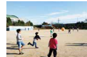
ボールを思いきり投げられる今、そんな場所は少ないのです