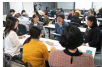
「伝えるコツ！」講座で活動の魅力話し合う参加者