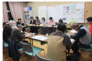
コミュニティ未成での打ち合わせ

11 月から各まちづくり協議会への訪問を始めていますが、そこではみなさんの「もっとまちづくり協議会のことを知って、かかわって欲しい」という思いとともに「どう伝えればいいのか」とのお悩みも感じました。まちづくりにかかわる人を増やすには、情報発信と情報公開は必須。各地に赴いてご説明し、パソコン自体に不慣れな方にも「やってみよう」と思ってもらえるように、一緒に取り組んでいきます。