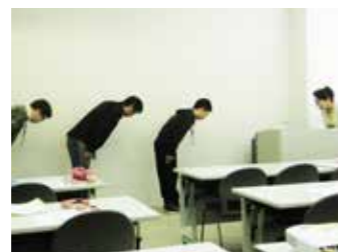
マナー講座でのお辞儀の練習