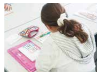
ライフプランを考える個人ワーク