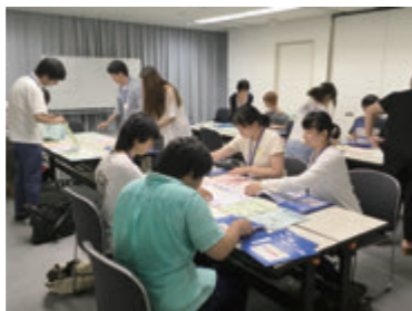
書類の仕分けから発送までを体験