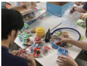
夏祭りの準備も若者たちの手で!