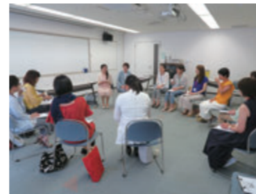
コラボ事業が生まれる予感も!