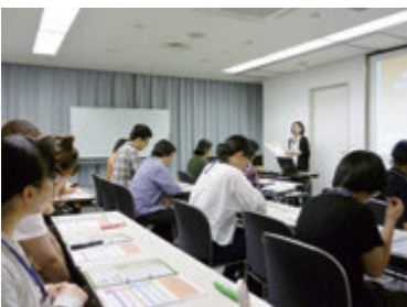
初日、意気込みが感じられます!

今、プログラムを通じて受講生たちの表情に変化の兆しが表れ始めています。プログラム修了後の彼らの成長を、私たちも心から楽しみにしています。