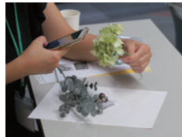
スマホでの写真撮影の勉強中