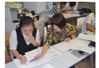
週1回開催の無料塾